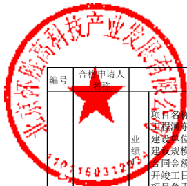
合格申请人商务信息公示表